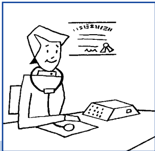
Mary is a doctor.

Se a palavra que vier depois começar com um som de consoante, a será usado.